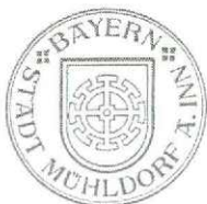
Günther Knoblauch 1. Bürgermeister