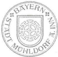
Günther Knoblauch 1. Bürgermeister